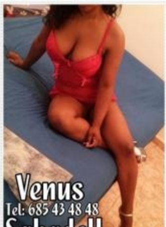
Venus Tel: 685 43 48 48 Sabadell ANUNCIOTIC