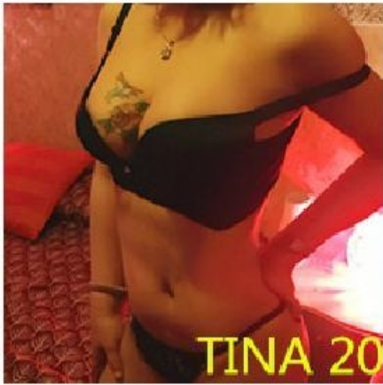
TINA 20 AÑOS