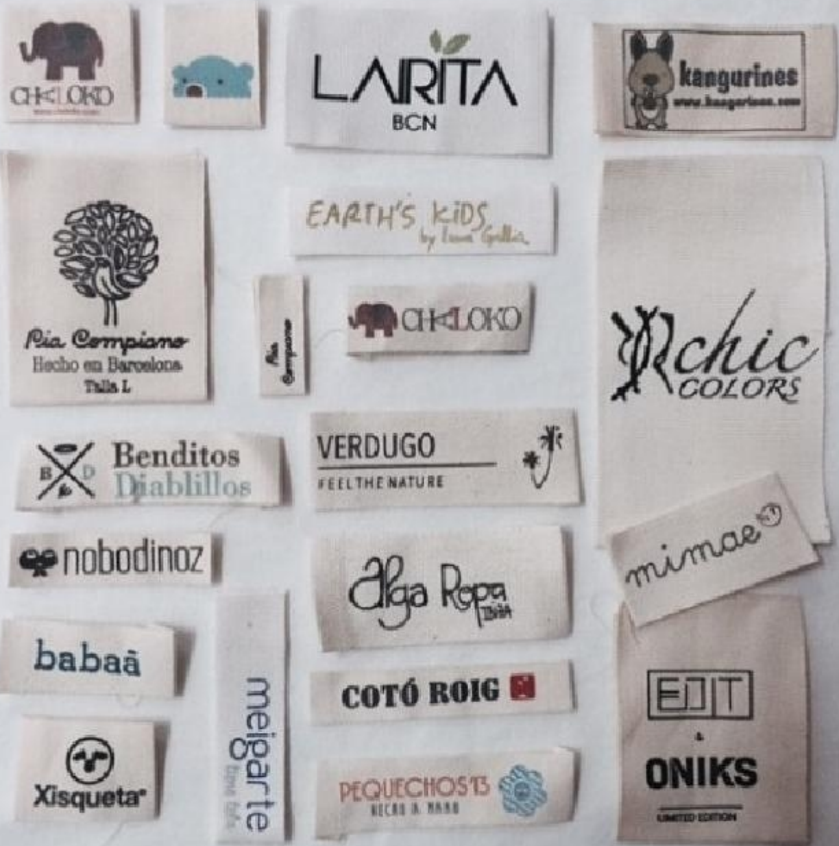
Megatex, fabricante etiquetas