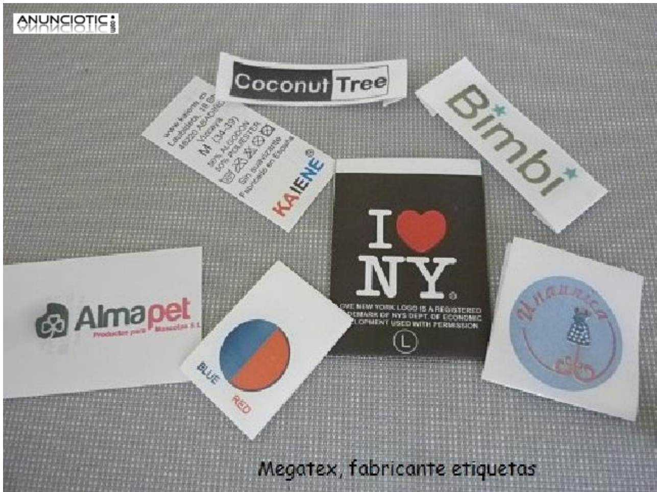
Megatex, fabricante etiquetas