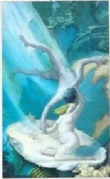
ACE OF CUPS