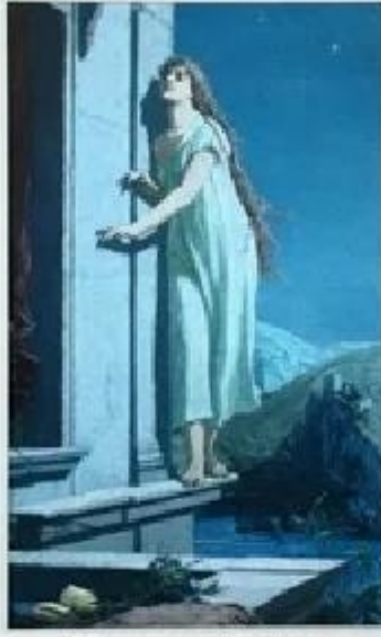
NINE OF SWORDS